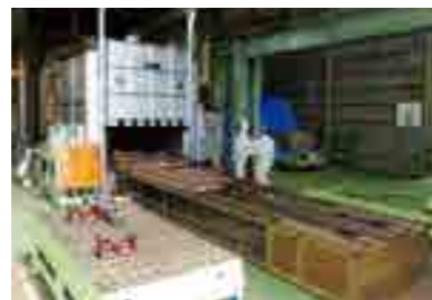
● ポリエチレン加熱炉