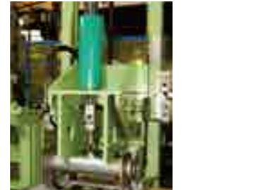
● バーリング加工機(SUS)