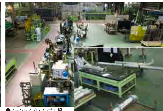
●ステンレスプレファブ工場