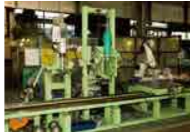
● バーリング加工機(SUS)