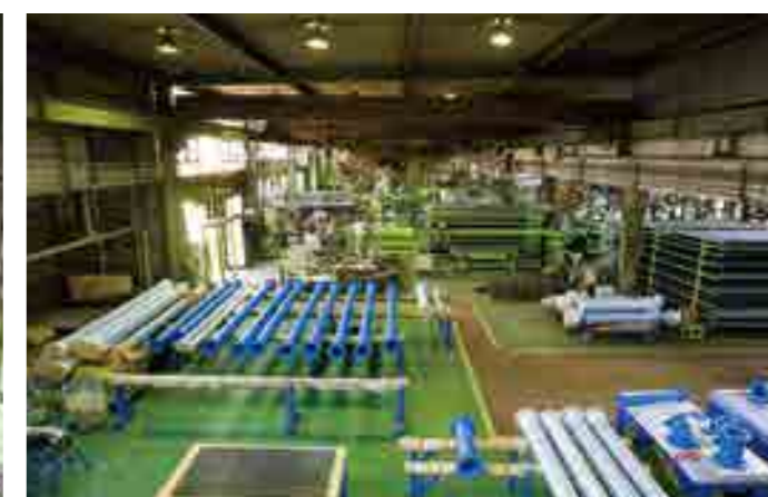
●ポリエチレンライニング工場