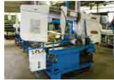
● バンドソー切断機(SUS)