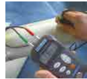
● 鋼管肉厚検査(超音波測定)