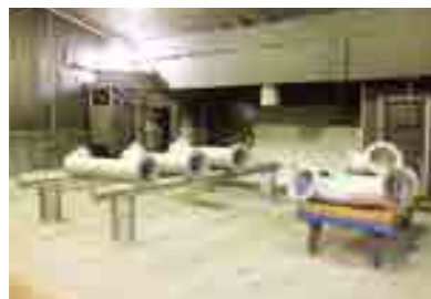
● ショットブラスト室