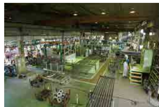
●塩ビライニング異径管ライン