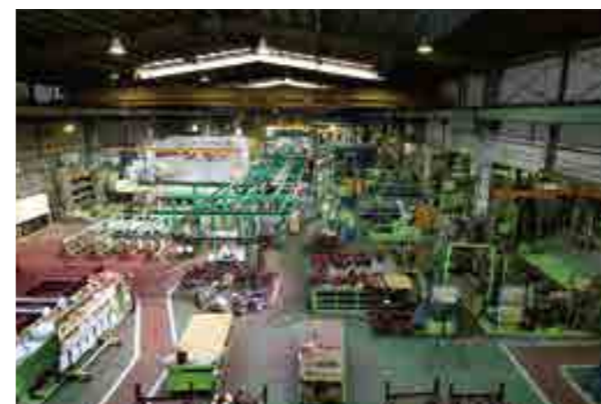
●塩ビライニング工場