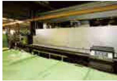
● LP直管ライニング機