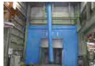
● ポリエチレン流動浸漬槽