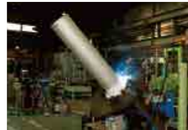
● ステンレスフランジ溶接機